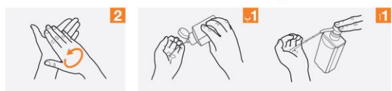
افرك اليدين بدعك الراحتين.