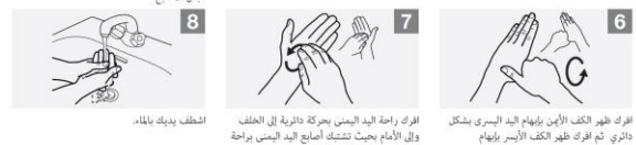
اشطف يديك بالماء.