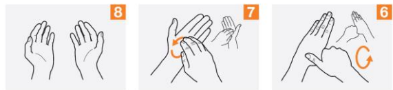
عندما تحب يدك، تصبح أمتة لتقديم الرعاية.