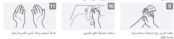
ها قد أصبحت يدك أمتين لتقديم الرعاية.