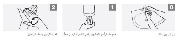
افرك اليدين بدعك الراحين.