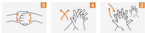
افرك ظهر أصابع اليد اليمنى مع راحة اليد اليسرى، وظهر أصابع اليد اليسرى مع راحة اليد اليمنى مع قبض الأصابع.