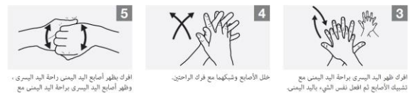
افرك ظهر أصابع اليد اليمنى راحة اليد اليسرى، وظهر أصابع اليد اليسرى براحة اليد اليمنى مع قبض الأصابع.