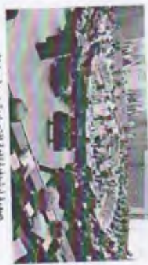
صورة إقليمية أثناء المنتدى الاقتصادي العالمي بالرياض

وتتمثل الرؤية الاستراتيجية للمملكة في تحقيق التنمية الاقتصادية المستدامة، وذلك من خلال التركيز على مجالات مثل الابتكار، والتعليم، والبيئة، والبنية التحتية. وتتمثل الرؤية الاستراتيجية للمملكة في تحقيق التنمية الاقتصادية المستدامة، وذلك من خلال التركيز على مجالات مثل الابتكار، والتعليم، والبيئة، والبنية التحتية. وتتمثل الرؤية الاستراتيجية للمملكة في تحقيق التنمية الاقتصادية المستدامة، وذلك من خلال التركيز على مجالات مثل الابتكار، والتعليم، والبيئة، والبنية التحتية.