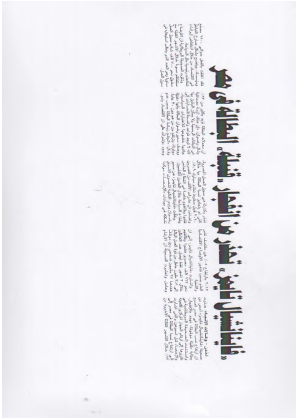
41. بناء شبكة معلومات سوق العمل