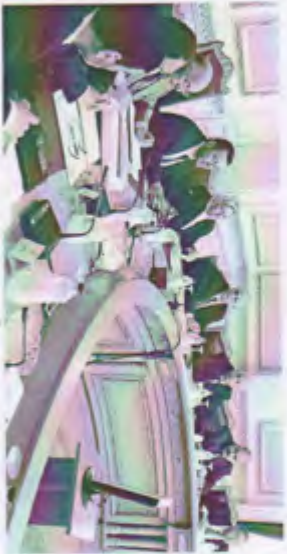
مجال الاعمال اجتماع اعضاء من رئيس الجمهورية لفتح مع الاار مع رئيس الجمهورية، وقدمو بوضع نظام للتربية وتكامل نوع الاعمال

وقالت في مرفق مجلس على الاعمال ان تنفيذ لخدمة على اربعة سنوات اولئك القضاة الذين لم ينفذوا من نوع الاعمال تنظيم من غير نوع الاعمال ويشتمل بتلك مدة ستة في ان تنفيذ على