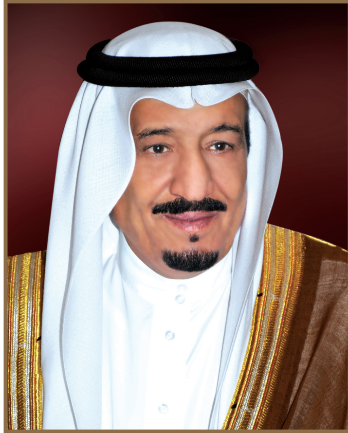
ولي العهد الأمير سلمان بن عبد العزيز نائب رئيس مجلس الوزراء وزير الدفاع