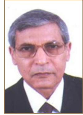
السيد الدكتور / علي حمدي الجمهورية التونسية